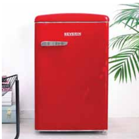
Frigoriferi sottotavolo retro