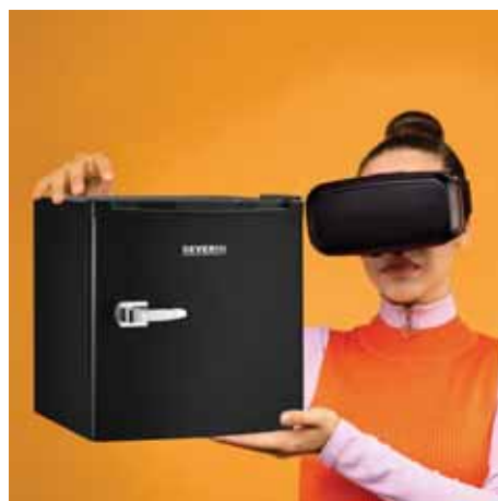
Frigo o Freezer retro