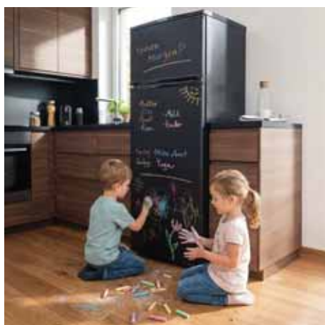
Frigoriferi doppia porta nero lavagna