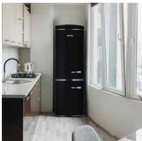
Frigoriferi combinato retro