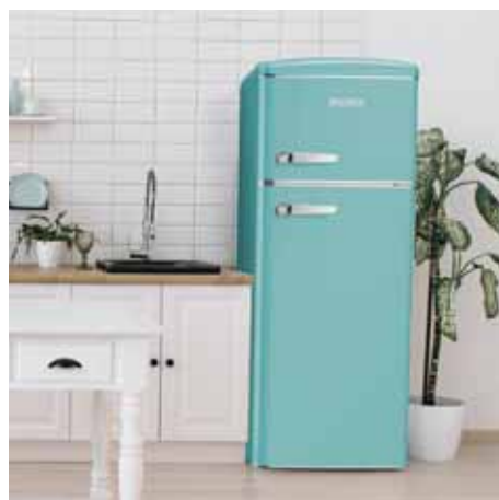
Frigoriferi doppia porta retro